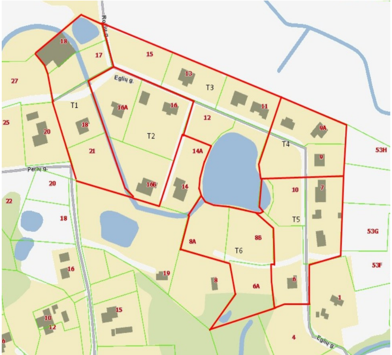
Situacijos schema. — planuojama teritorija ir zonos.