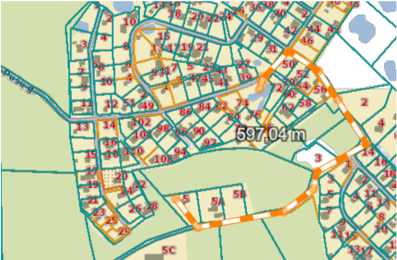
Schema Nr.2. Atstumas nuo planuojamos teritorijos iki vandens telkinio.